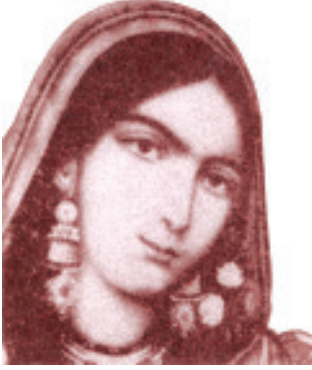
बेगम हज़रत महल

गया। कई महीनों तक उत्तरी और मध्य भारत के विस्तृत भूभाग पर विद्रोहियों का कब्ज़ा रहा।