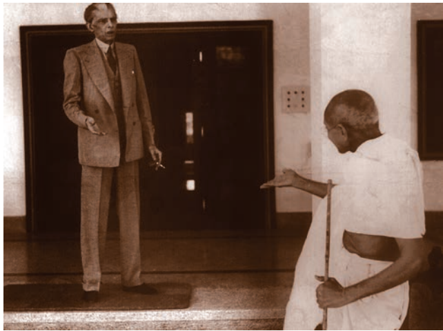
जिन्ना और गांधी

जिसे सांप्रदायिक समस्या कहा जाता था, वह अल्पसंख्यकों के अधिकारों के साथ इस तरह तालमेल बैठाना था ताकि उन्हें बहुसंख्यकों के खिलाफ़ पर्याप्त संरक्षण मिल सके। भारत के अल्पसंख्यक यूरोप की तरह जातीय या राष्ट्रीय अल्पसंख्यक नहीं, वे धार्मिक अल्पसंख्यक हैं। जातीय दृष्टि से भारत में एक विचित्र मिश्रण है, पर जातीय सवाल भारत में न कभी उठे हैं न उठ सकते हैं। धर्म इन जातीय विभिन्नताओं के ऊपर है। जातियाँ या तो एक दूसरे में मिल जाती हैं या उनमें अंतर करना कठिन होता है। ज़ाहिर है कि धार्मिक दीवारें स्थायी नहीं होतीं और जो व्यक्ति अपना धर्म बदलता है उसकी जातीय पृष्ठभूमि या उसकी जातीय और भाषिक विरासत नष्ट नहीं हो जाती। परंतु राजनीतिक मामलों में, धर्म का स्थान सांप्रदायिकता ने ले लिया है। यह एक संकीर्ण समुदाय