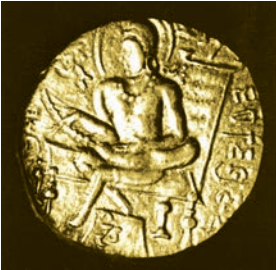
समुद्रगुप्त वीणा बजाते हुए—एक सिक्का

नहीं तोड़ा बल्कि उसके सांस्कृतिक आदर्शों और सामाजिक ढाँचे के लिए भी खतरा पैदा कर दिया। इनके विरुद्ध जो प्रतिक्रिया हुई उसका रूप मूलतः राष्ट्रवादी था। उसमें राष्ट्रवाद की शक्ति भी थी और संकीर्णता भी। धर्म और दर्शन, इतिहास और परंपरा, रीति-रिवाज और सामाजिक ढाँचा, जिसके व्यापक घेरे में उस समय के भारत के जीवन के सभी पहलू आते थे, जिसे ब्राह्मणवाद या हिंदूवाद कहा गया, वह इस राष्ट्रवाद का प्रतीक बना। यह दरअसल राष्ट्रीय धर्म था, जिससे वे तमाम गहरी जातीय और सांस्कृतिक प्रवृत्तियाँ प्रभावित हुईं जो आज हर जगह राष्ट्रीयता की बुनियाद में मौजूद हैं। जिस बौद्ध धर्म का जन्म भारतीय विचार से हुआ था, उसके लिए भारत वह पुण्य भूमि थी जहाँ बुद्ध ने जन्म लिया, उपदेश दिया और वहीं उनका निर्वाण हुआ। पर बौद्ध धर्म मूल रूप में अंतरराष्ट्रीय था, विश्वधर्म था। जैसे-जैसे उसका विकास और विस्तार हुआ वैसे-वैसे उसका यह रूप और विकसित होता गया। इसलिए पुराने ब्राह्मण धर्म के लिए स्वाभाविक था कि वह बार-बार राष्ट्रीय पुनर्जागरण का प्रतीक बने।