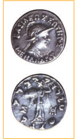
हिंद-यूनानी शासक मेनांडर का एक सिक्का

मध्य-एशिया में शक (सीदियन) लोग ऑक्सस (अक्षु) नदी की घाटी में बस गए थे। यूइ-ची सुदूर पूरब से आए और उन्होंने इन लोगों को उत्तर-भारत की ओर धकेल दिया। ये शक बौद्ध और हिंदू हो गए। यूइ-चियों में से एक दल कुषाणों का था। उन्होंने सब पर अधिकार करके उत्तर-भारत