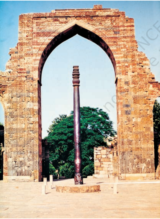
महरौली (दिल्ली) में कुतुबमीनार के परिसर में खड़ा लौह-स्तंभ, जिसका निर्माण लगभग 1500 साल पहले हुआ

ईसवी सन् की आरंभिक शताब्दियों में भारत में रसायनशास्त्र का विकास और देशों की तुलना में शायद अधिक हुआ था। भारतीय, प्राचीन काल से ही फ़ौलाद को ताव देना जानते थे। भारतीय फ़ौलाद और लोहे की दूसरे देशों में बहुत कद्र की जाती थी, विशेष रूप से युद्ध के