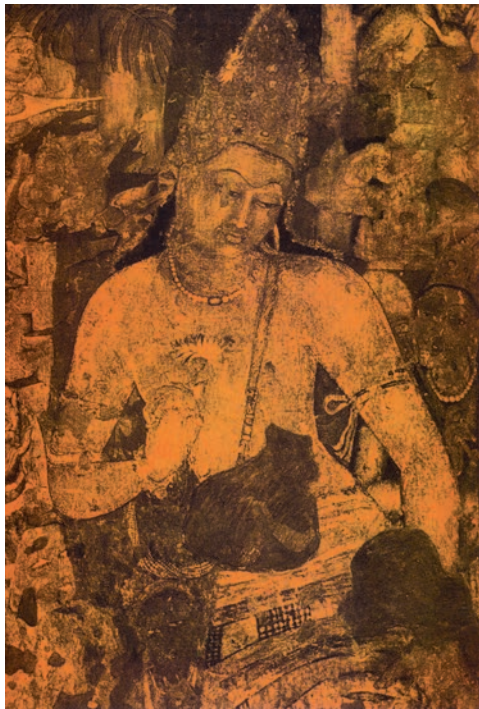
अजंता का एक चित्र

सातवीं-आठवीं शताब्दियों में ठोस चट्टान को काटकर एलोरा की विशाल गुफाएँ तैयार हुईं, जिनके बीच में कैलाश का विशाल मंदिर है। यह अनुमान करना कठिन है कि इंसान ने इसकी कल्पना कैसे की होगी या कल्पना करने के बाद अपनी कल्पना को रूपाकार कैसे दिया होगा। एलीफेंटा की गुफाएँ भी इसी समय की हैं जहाँ प्रभावशाली और रहस्यमयी त्रिमूर्ति बनी है। दक्षिण भारत में महाबलीपुरम् की इमारतों का निर्माण भी इसी समय हुआ था।