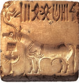
एक हड़प्पाई मुहर

भारत के अतीत की सबसे पहली तस्वीर उस सिंधु घाटी सभ्यता में मिलती है, जिसके अवशेष सिंध में मोहनजोदड़ो और पश्चिमी पंजाब में हड़प्पा में मिले हैं। इन खुदाइयों ने प्राचीन इतिहास की समझ में क्रांति ला दी है।