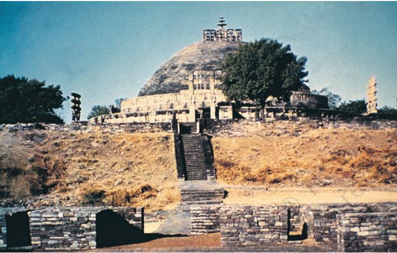
अशोक के समय में निर्मित साँची का स्तूप

इस अद्भुत शासक ने, जिसे आज भी भारत और एशिया के बहुत से दूसरे भागों में प्यार से याद किया जाता है, अपने आपको बुद्ध की शिक्षा के प्रचार में, नेकी और सद्भाव के काम में तथा प्रजा के हित के लिए सार्वजनिक कार्यों के प्रति समर्पित कर दिया। उसने ऐलान कर दिया था कि वह इनके लिए हमेशा तैयार है। हर स्थान पर और हर समय, सरकारी कर्मचारी जनता के कार्यों के बारे में उसे बराबर सूचना देते रहें, चाहे जिस समय और जहाँ भी हो वह लोक-हित के लिए अवश्य काम करेगा।