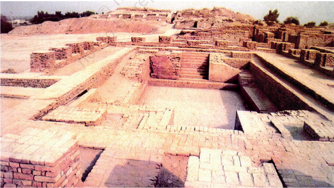
मोहनजोदड़ो का महान स्नानागार

सिंधु घाटी सभ्यता और वर्तमान भारत के बीच समय के ऐसे कई दौर गुज़रे हैं जिनके बारे में हम बहुत कम जानते हैं। वैसे भी इस बीच असंख्य परिवर्तन हुए हैं। लेकिन भीतर ही भीतर निरंतरता की ऐसी शृंखला चली आ रही है जो आधुनिक भारत को छः-सात हज़ार पुराने उस बीते हुए युग से जोड़ती है जब संभवतः सिंधु घाटी सभ्यता की शुरुआत हुई थी। यह देखकर अचरज होता है कि मोहनजोदड़ो और हड़प्पा में कितना कुछ ऐसा है जो हमें